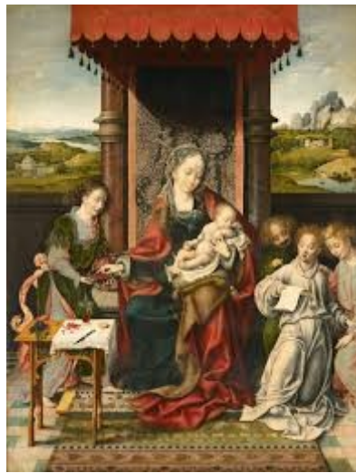
Joos van Cleve, Matka Boska z Dzieciątkiem i aniołami , XVIw.