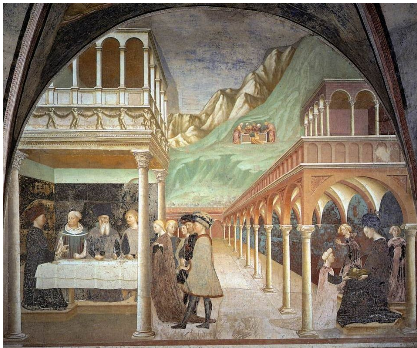
Masolino, Uczta Heroda , XVw.