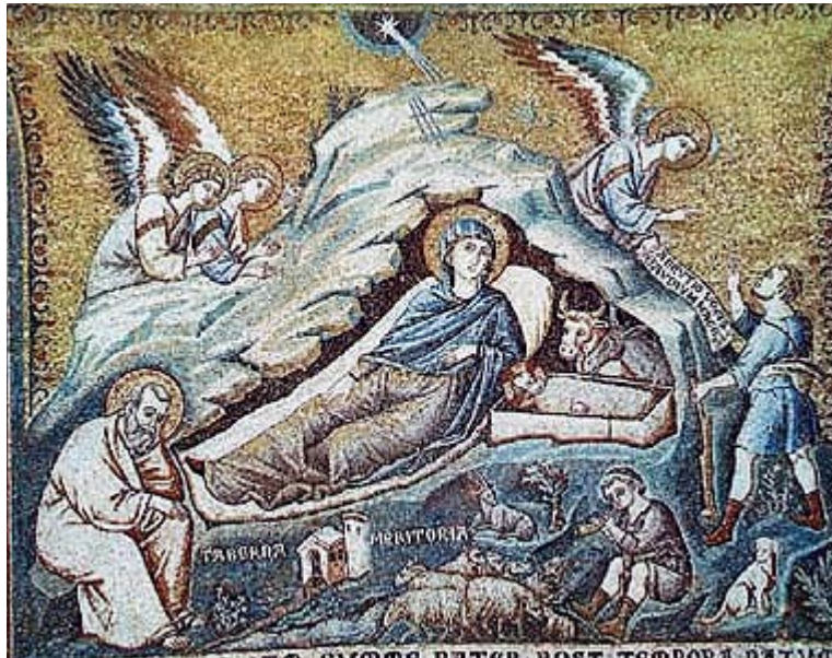
Pietro Cavallini, mozaika „Narodziny Jezusa” w kościele Santa Maria in Trastevere w Rzymie, XIIIw.

Perspektywą nazywamy przedstawienie przestrzennych obiektów na płaskiej powierzchni zgodnie z tym, jak je widzimy. Perspektywa jest stosowana przez rysowników i malarzy, można ją dostrzec również w fotografii. W starożytności i średniowieczu stosowano perspektywę odwróconą, w której ważne postacie były ukazywane jako większe.