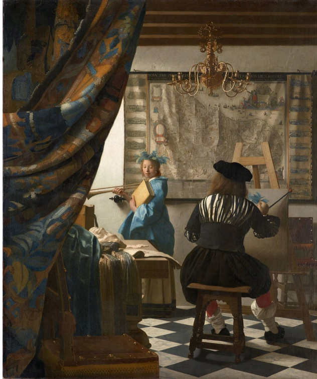
Johannes Vermeer, Alegoria malarstwa , XVIIw.