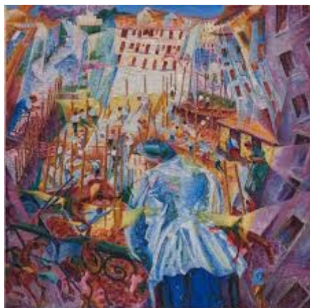
Umberto Boccioni, Ulica wchodzi do domu , XXw.