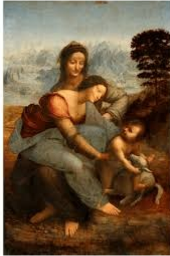
Leonardo da Vinci, Św. Anna Samotrzecia , XVIw.