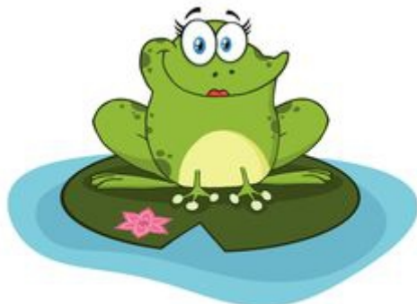
© Can Stock Photo (myśli, spokojnie)