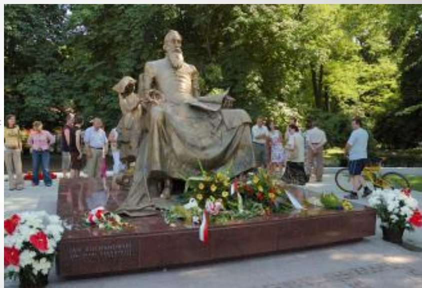
Pomnik poety przy ulicy Żeromskiego