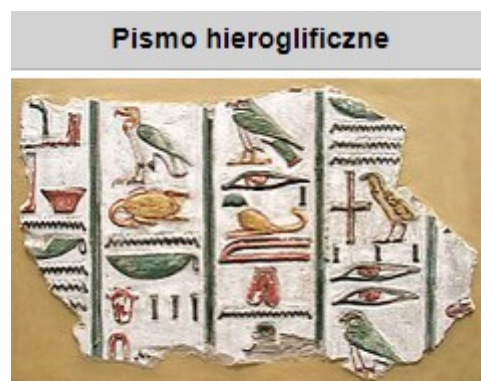
Hieroglify z Wielkiej Sali Hypostylowej w Karnaku (Seti I, XIII w. p.n.e.)

Hieroglify – pismo starożytnego Egiptu, które przyjmowało formę obrazkową: https://pl.wikipedia.org/wiki/Hieroglify