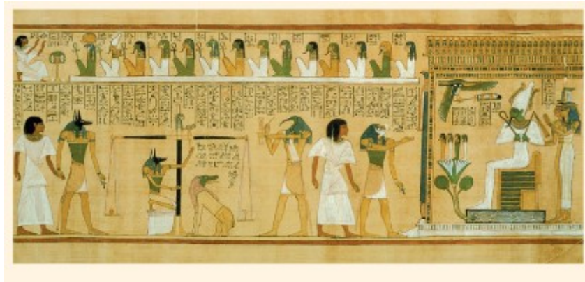
Papirus z Księgi Umarłych , ok.

Muzeum Brytyjskie w Londynie słynie z największej liczby zabytków sztuki egipskiej w Europie. Są tam m.in. mumie , czyli zachowane ciała zmarłych, elementy budowli, płaskorzeźby, rzeźby, posągi oraz kamienne sarkofagi – grobowce. W muzeum pojawiają się rzeźby kotów – świętego zwierzęcia Egipcjan. Również zgromadzono tam wiele malowideł na papirusie – materiale podobnym do papieru, uzyskiwanym z rośliny rosnącej nad Nilem.