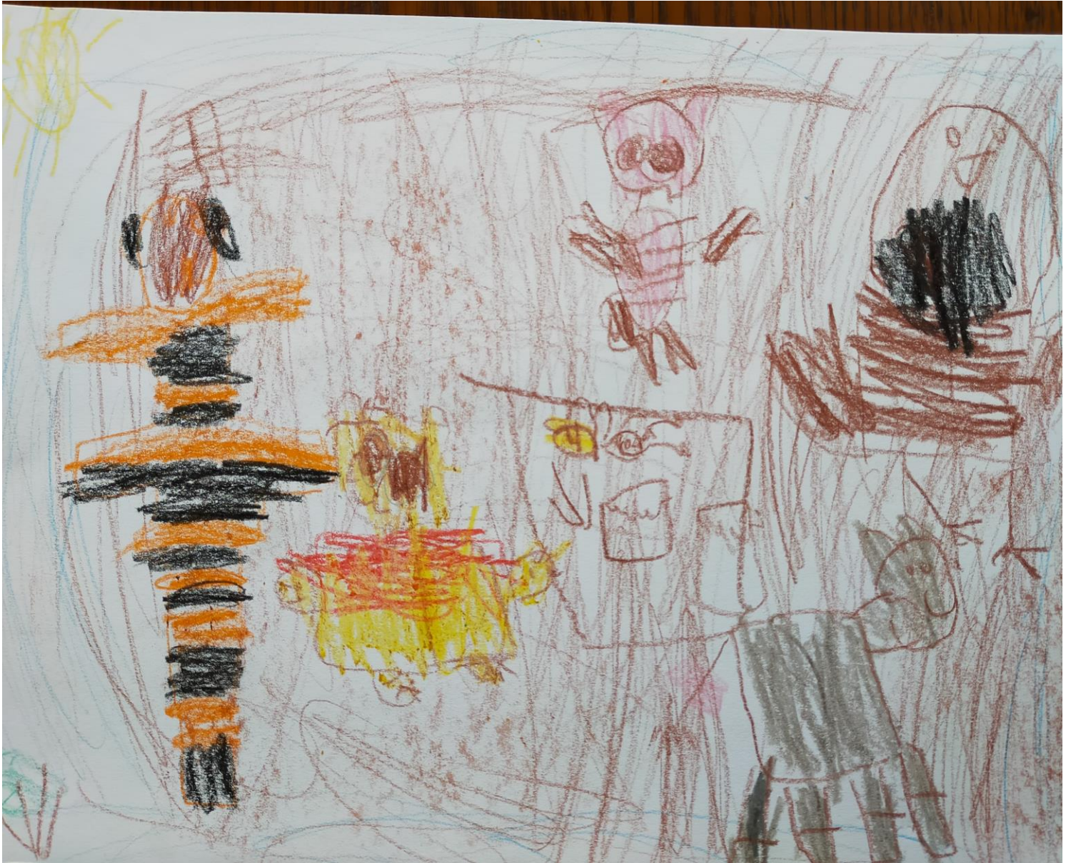
ADAM 1st 5