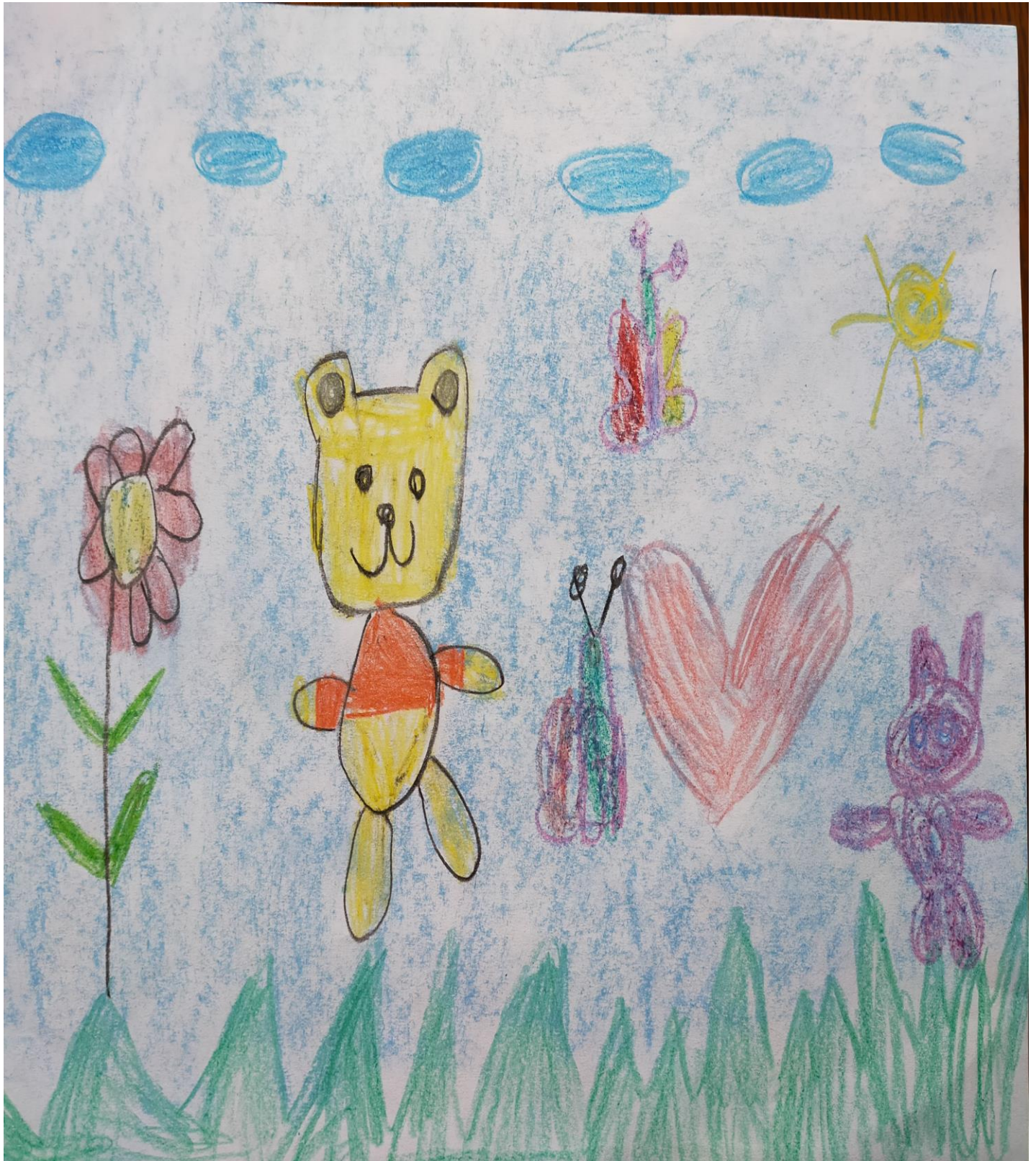
ZUZANNA LAT 6