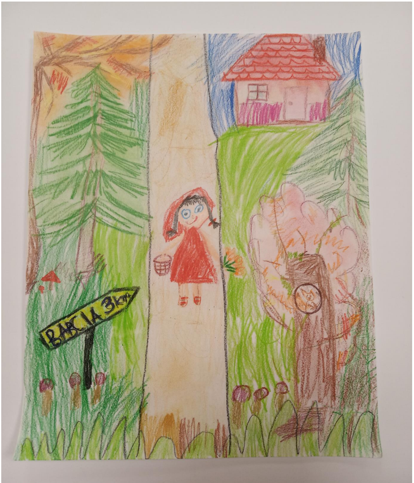
ZUZANNA LAT 5