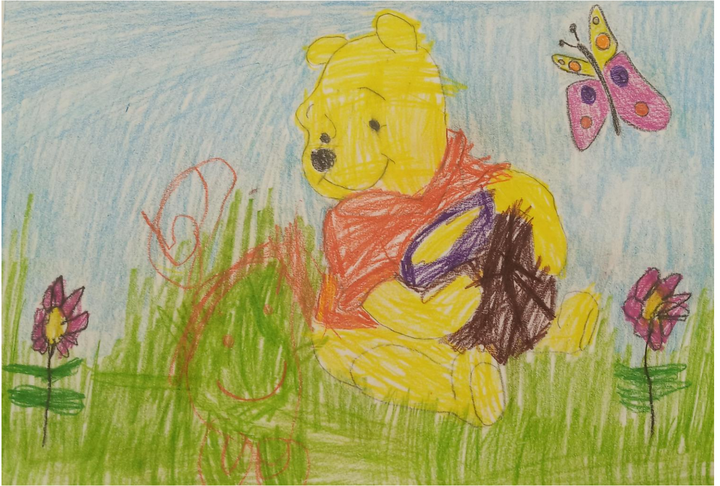
ZUZANNA LAT 6