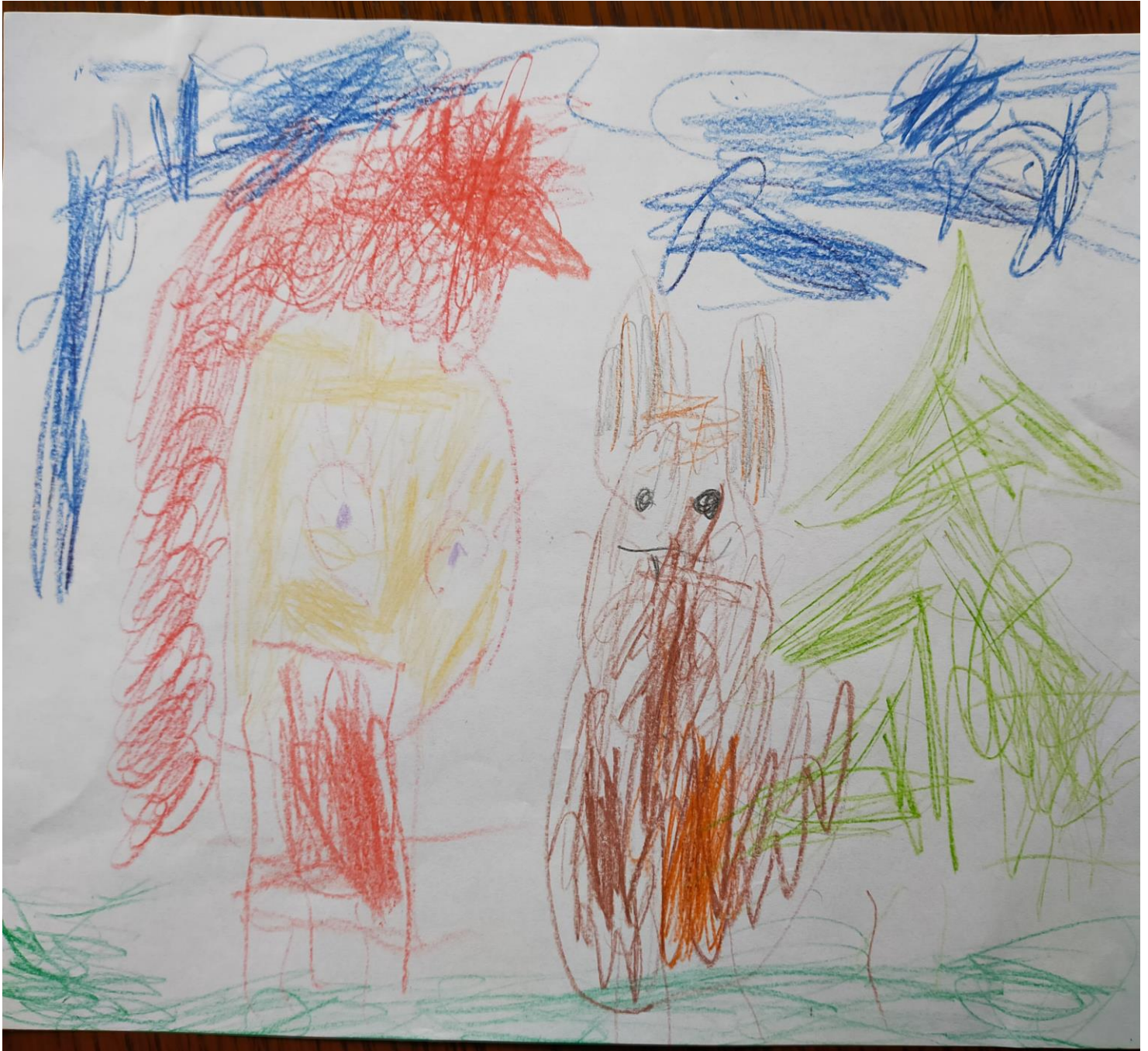
KALINA LAT 3,5