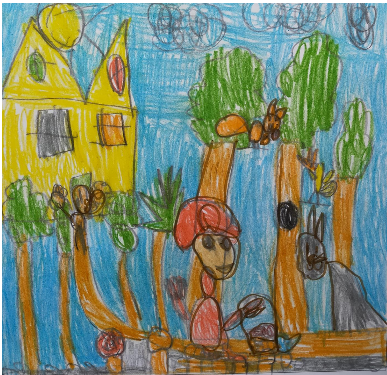
TYMOTEUSZ I KLASA