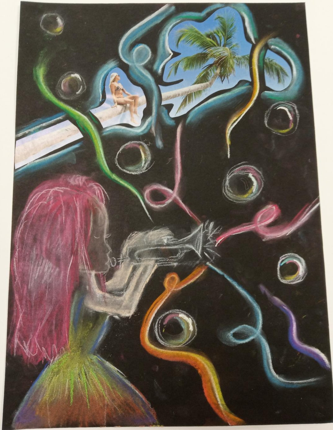
JULIA VI KLASA