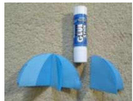
CZĘŚCI 1 i 2