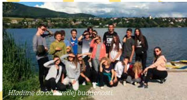
Hľadáme do očí svetlej budúcnosti.