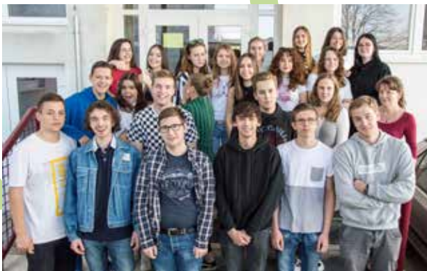
organizácia imatrikulácií, október 2019