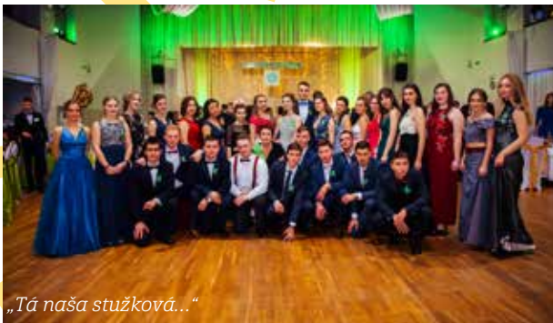
„Tá naša stužková...“