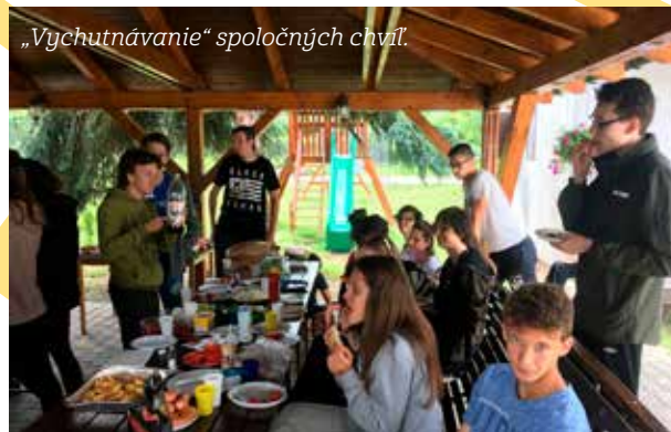
„Vychutnávanie“ spoločných chvíľ.