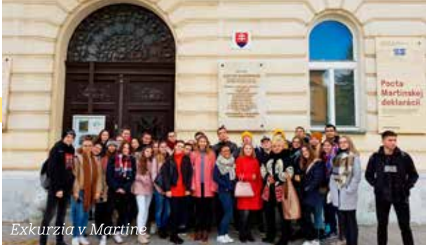
Exkurzia v Martine