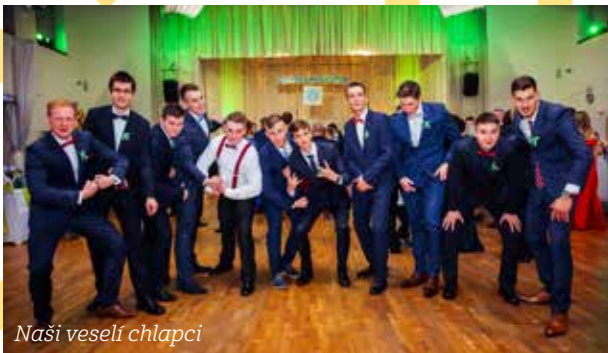
Naši veselí chlapci