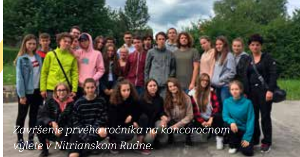
Završenie prvého ročníka na koncoročnom výlete v Nitrianskom Rudne.

p.p.: Kedy bude vaše mentálne zrenie priamo úmerné vášmu fyzickému?