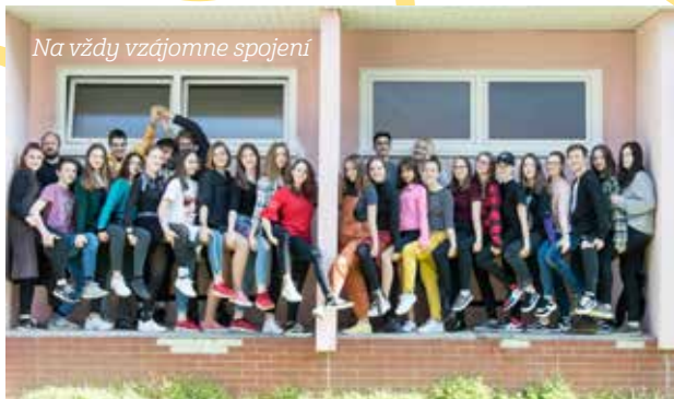
Na vždy vzájomne spojení