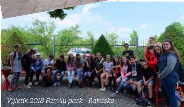
Výletík 2018 Family park - Rakúsko