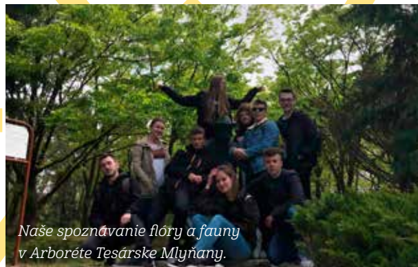
Naše spoznávanie flóry a fauny v Arboréte Tesárske Mlyňany.