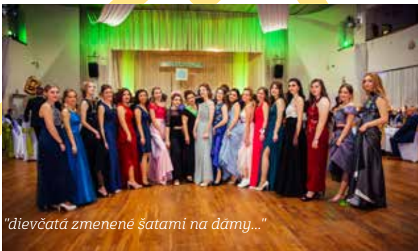
„dievčatá zmenené šatami na dámy...“