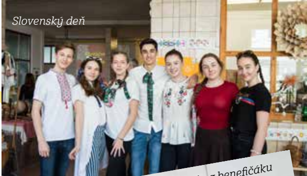
Umelci na benefičáku