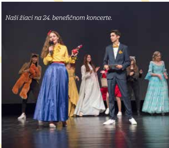
Naši žiaci na 24. benefičnom koncerte.

Celkovo prefinancovala škola na nákup pomôcok a techniky finančné prostriedky vo výške 56 tis. €.