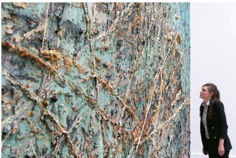
Wystawa Anselma Kiefera [czyt.: anzelma kifera] w Królewskiej Akademii Sztuki w Londynie